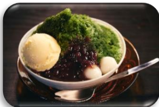
まっちゃ 抹茶スイーツ